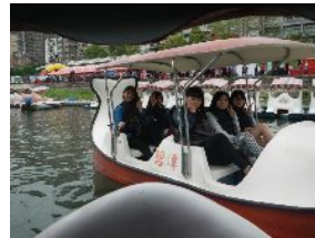
地元の高校生と湖で白鳥のボートに乗りました。

・忠烈祠 兵隊が沢山いました。抗日戦争や中共で戦死した方の霊が眠っているところです。