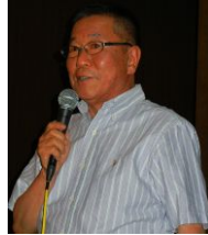
雑誌・広報 水越委員長