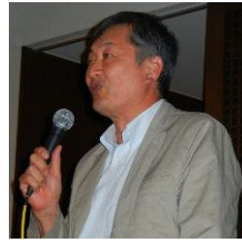
出席・ニコニコ箱 野間委員長