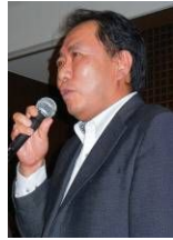
長期計画特別 大友委員長