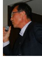
職業・社会奉仕 柳委員長