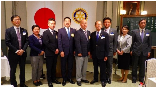
新旧会長・幹事感謝状並びに記念品・バッチの交換